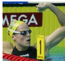
Laure Manaudou PS

602 zawodniczek i zawodników z 40 krajów, w tym 28 Polaków, wystartuje w rozpoczynających się w poniedziałek w Budapeszcie pływackich mistrzostwach Europy na długim basenie. Rozegranych zostanie 38 konkurencji, z czego 32 indywidualnie.