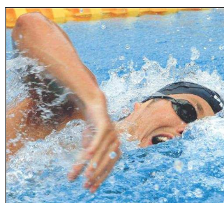
Pieter van den Hoogenband - zwycięzca 200 m kraulem